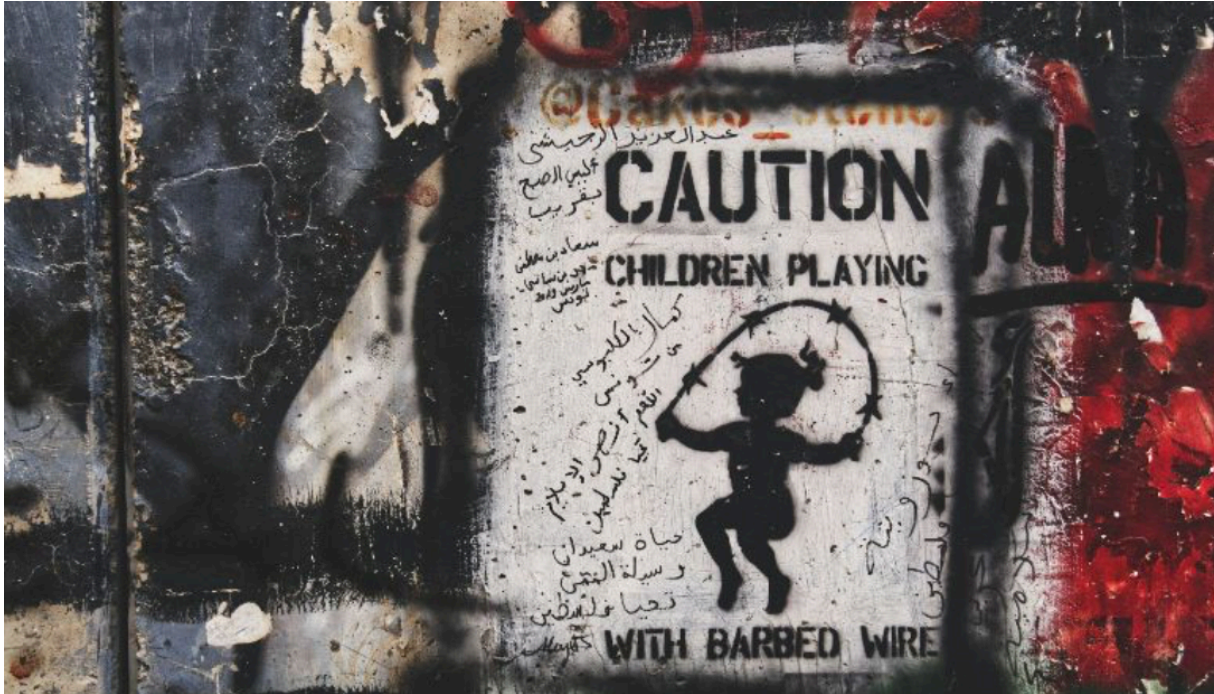
een foto uit Gaza

“Alles heeft zijn grens - alleen drieste schaamteloosheid is grenzeloos.” Dit schreef Korczak op 22 juli 1942 (ruim twee weken voor hij met de kinderen werd weggevoerd) in zijn dagboek.