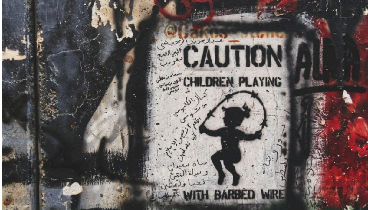
een foto uit Gaza

"Alles heeft zijn grens - alleen drieste schaamteloosheid is grenzeloos." Dit schreef Korczak op 22 juli 1942 (ruim twee weken voor hij met de kinderen werd weggevoerd) in zijn dagboek.