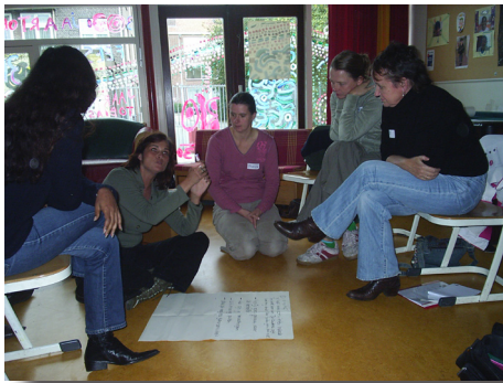
En de dialoog in het team ..?!

Korczak leerde uit zijn eigen praktijk hoe belangrijk het was om naar kinderen te luisteren. Hij merkte dat je, als je je openstelt voor kinderen en voor wat hen bezighoudt, heel veel van kinderen kunt leren. Betekent dat dan dat je kinderen altijd hun zin moet geven? Nee, zeker niet. Korczak is daar heel duidelijk over.